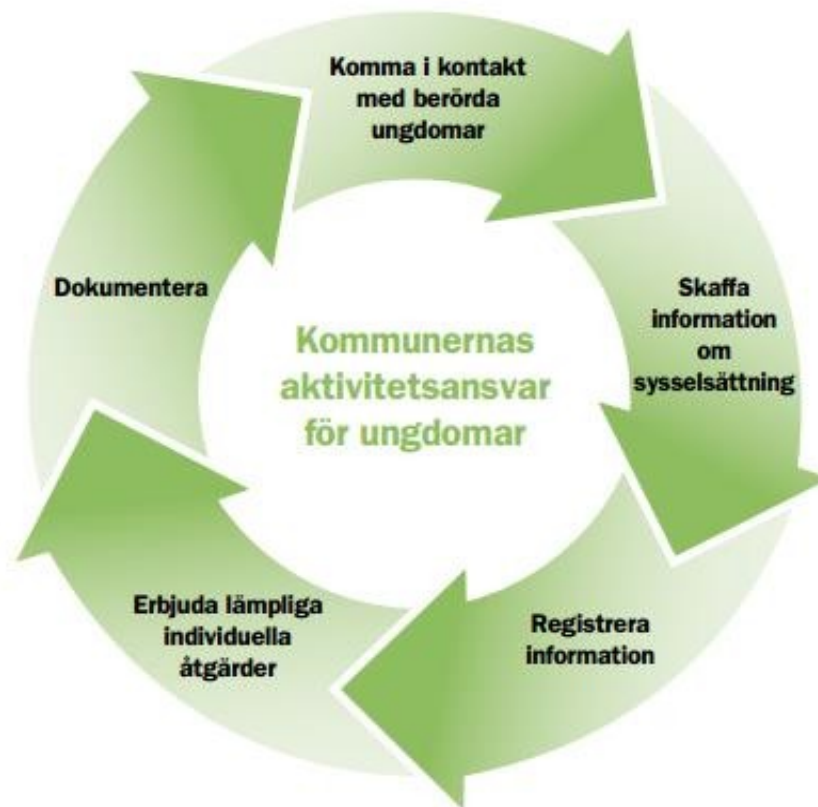
Fig. 1 Kommunernas aktivitetsansvar för ungdomar löper under hela året.