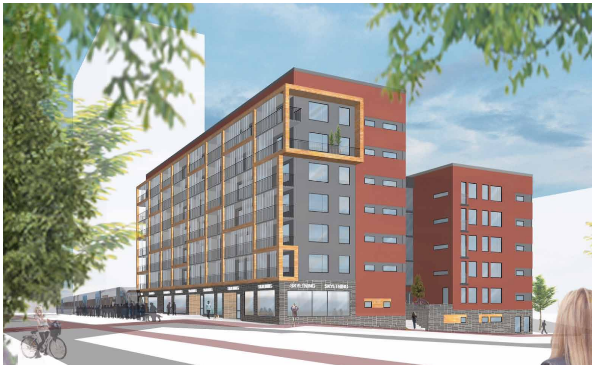
I början av 2016 är första inflyttning i de bostadshus som nu börjar byggas på Landsvägen.

Alla vet att hela Stockholmsregionen är i ett skriande behov av bostäder, och särskilt av hyresrätter.