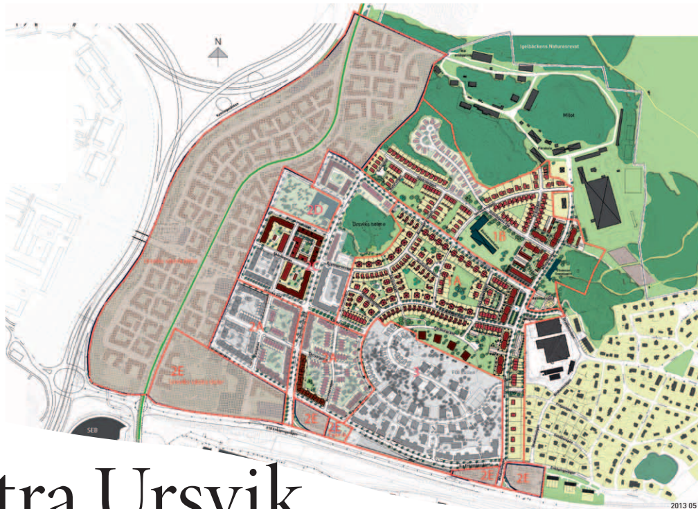
Västra Ursvik: Nu har planeringen kommit till Ursviks västra delar – den gråmarkerade delen till vänster på kartan.