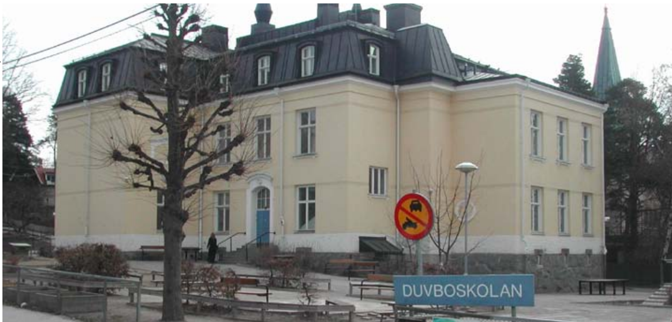
Duvboskolan är byggd i början av 1900-talet och totalrenoverades 1993.