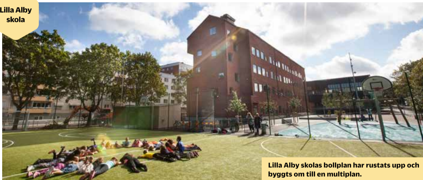
Lilla Alby skolas bollplan har rustats upp och byggts om till en multiplan.