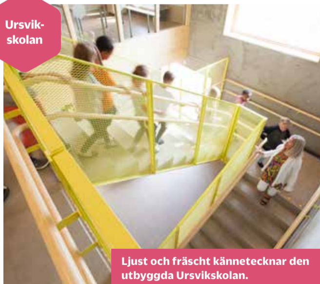
Ljust och fräscht kännetecknar den utbyggda Ursvikskolan.