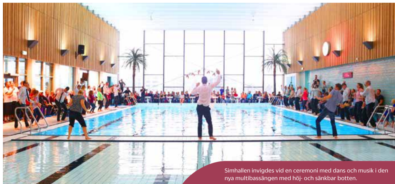
Simhallen invigdes vid en ceremoni med dans och musik i den nya multibassängen med höj- och sänkbar botten.