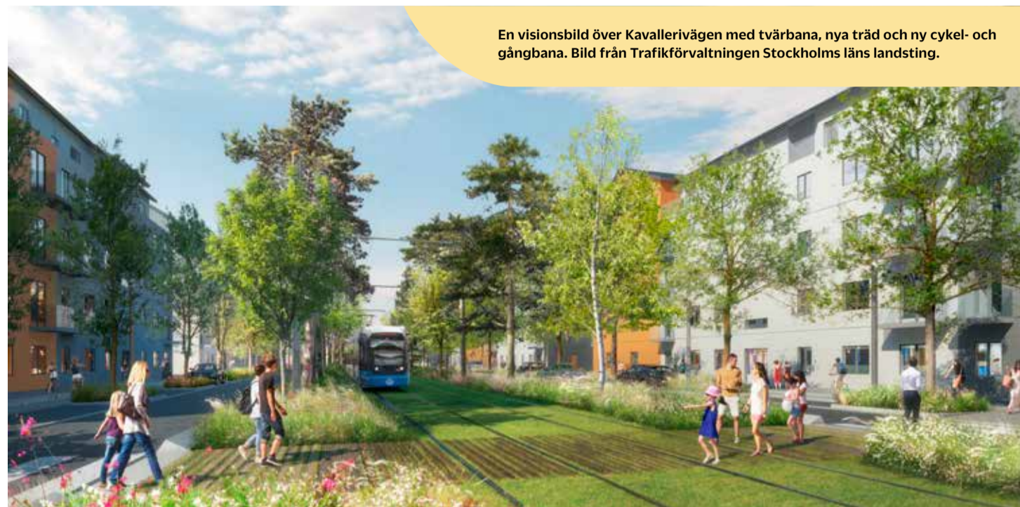
En visionsbild över Kavallerivägen med tvärbana, nya träd och ny cykel- och gångbana.

Rissne – en byggarbetsplats? Jodå. Det är ganska stökigt just nu och ibland kan det vara lite besvärligt att ta sig fram. Men runt hörnet väntar en stadsdel som är både tryggare, tillgängligare, full av liv och med egen tvärbane-station.