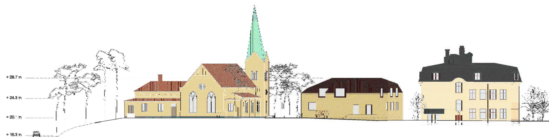
Illustration mot Alms väg med kyrkan nya byggnaden och skolan. Nya byggnadens fasad ska putsas fasad och taket beläggas med plåt