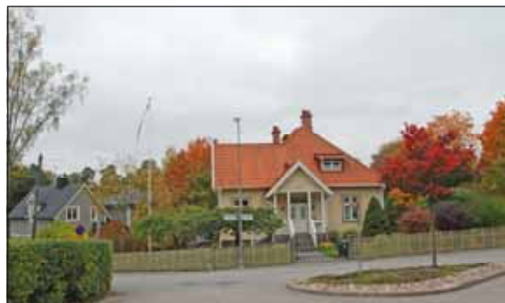
Fig. 20. Trästäketen sätter prägel på området.

Som motiv för riksintresset Duvbo har Riksantikvarieämbetet anfört: "Villasamhället Duvbo, som utbyggdes under en relativt kort tidsperiod, är det första exemplet i Stockholmstrakten på välorganiserad egnahemsförstad avsedd för arbetare, ett exempel som skulle få flera efterföljare."