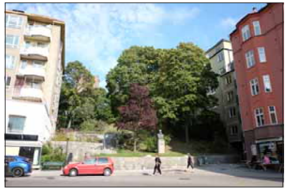
Fig. 10. Vattentornsparken.