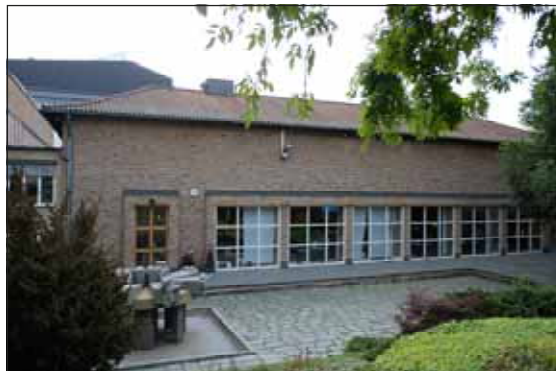
Fig. 17. Maraboufabrikens byggnader uppvisar hög arkitektonisk kvalitet. Här den före detta personalmatsalen.