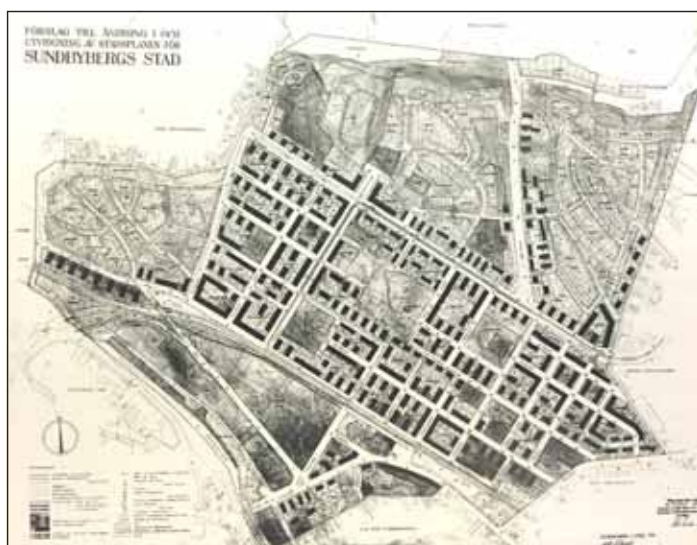
Fig. 4. Ovan ses kartan till stadsplanen som antogs av Sundbybergs stadsfullmäktige 1941 och stadfästes av Kunglig Maj; t 1942.

Den första stadsplanen antogs 1888 och utformades som en klassisk rutnätsplan. På 1880-talet började Lofström även sälja industrimark. Därmed kom Sundbyberg att utvecklas till ett mer självständigt industri- och stationssamhälle, som 1888 bröts ut ur Bromma socken och bildade köping. De första industrierna var småskaliga, men kring sekelskiftet 1900 fanns större etableringar, med Max Sieverts Fabriks AB som mest framträdande exempel.