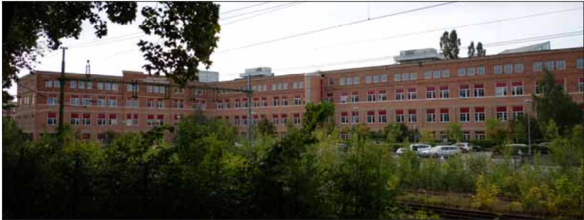
Fig. 15. Före detta Sieverts kabelfabrik har en långsträckt fasad, exponerad mot stadens norra sida.