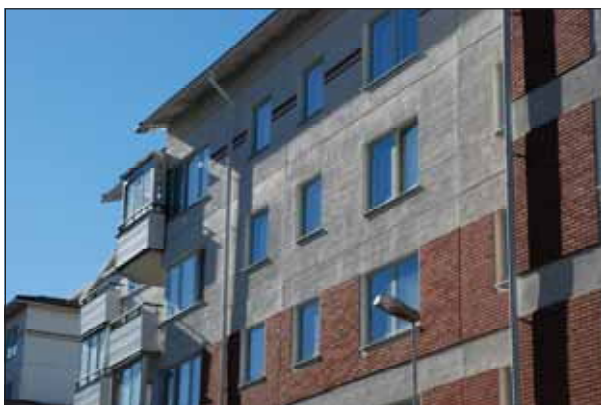
Fig 27. Vikingen.

men proportionerna skiljer sig stort mellan byggnadsvolymer. Variation skapas också genom skilda takhöjder och fasadliv. Asfalterade ytor varieras med gatsten i skilda läggningar, jämte betongplattor.