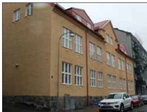
Fig. 11. Före detta industribyggnad vid Vattugatan.