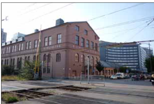
Fig. 1. Där esplanaden korsar järnvägen är idag den mest centrala övergången mellan Sundbyberg norr och söder om Järnvägen.