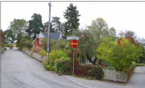
Fig. 19. Korsningen Långlötsvägen-Karlavägen.

Duvbo var ett torp som på 1800-talet utvecklades till en mer betydande egendom, med eget tegelbruk. Efter att tegelbruket lades ned 1895 bytte gården ägare och såldes vidare till AB Hus på Landet , vars