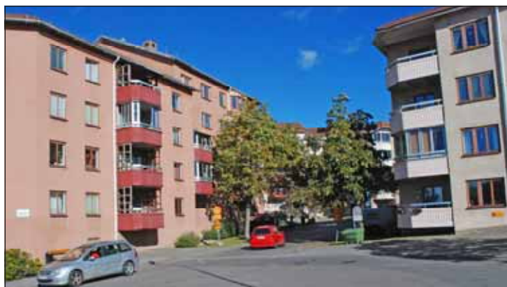
Fig 28. Skvadronen.

Utöver husen från fastighetsbolagets utbyggnad fanns sedan tidigare i Storskogen Sundbybergs värme-central från 1953, Ängskolan från mitten av 1950-talet, samt i västra delen ett äldre villakvarter. Ett ålderdomshem från 1951 stod förut i kvarteret Viggen där nu moderna punkt- och lamellhus har uppförts.