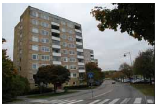
Fig. 38. Punkthus vid Örsvängen.

Gårdsrummen har tills nyligen varit belagda med kvadratiska betongplattor och rabatter med gjutna betongramar. Vid förnyelse de senaste åren ersätts betongplattorna med annan beläggning.