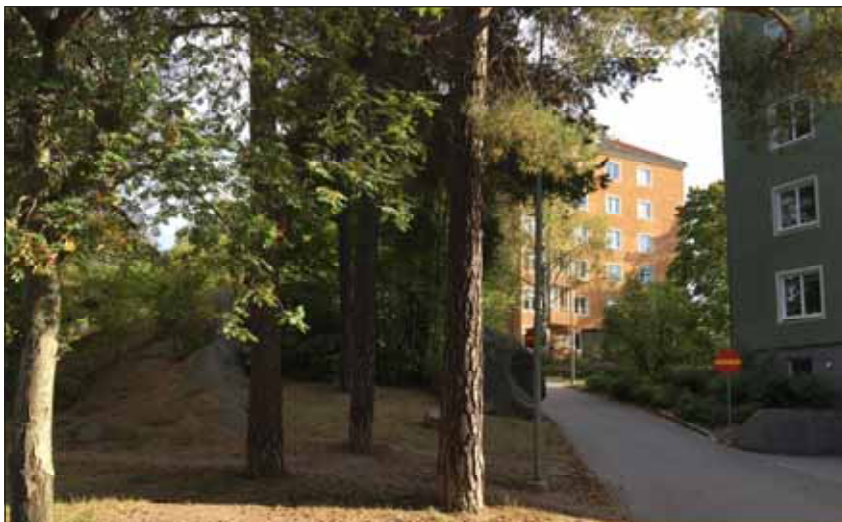
Fig. 13. På norra sidan om Tulegatan finns ett punkthusområde från 1940-talet, anlagt enligt principen "hus i park".

I stadens utkant mot nordost, nedanför Kyrkparken, finns friliggande punkthus från 1960-talet, sju våningar höga mot Götgatan och tio våningar mot Tulegatan. Den höga, fritt placerade bebyggelsen kontrasterar mot rutnätsstaden. På norra sidan Tulegatan följs den stora skalan upp med punkthus i 6-12 våningar från samma tidsperiod. Tillsammans utgör byggnaderna en sammanhållen 1960-talsmiljö. Fasaderna är putsade och färgsatta i blekt grå/grön nyans. I husens bottenvåningar finns verksamhetslokaler och mellan huskropparna en upphöjd torg-