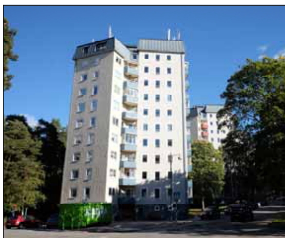
Fig 30. Stjärnhusen.