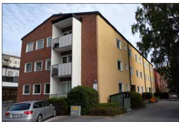
Fig. 24. Välgestaltad efterkrigstidsbebyggelse.

Lilla Alby präglas idag av efterkrigstidens flerbostadsbebyggelse bestående av lamellhus och punkthus från 1940-, -50 och -60- och 70-talen. Flera av husen är arkitektoniskt intressanta och