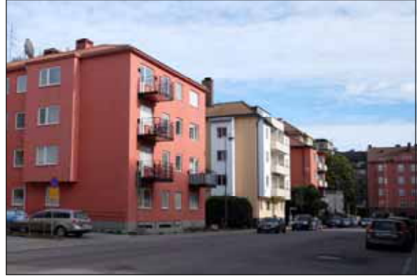
Fig. 8. Öppet kvarter vid Vegagatan.