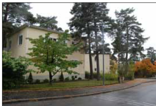
Fig. 31. Området är utformat med organiskt format gatunät och ett stort inslag av tall och annan inhemska växtlighet.

Sim- och sporthallsbyggnaderna vid Sundbybergs idrottsplats är tidstypiska exempel på idrottsbyggnader från 1950- och 1970-talet.