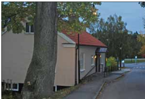
Fig. 21. Ekbackens grindstuga.

Ekbackens sjukhusområde ligger på en höjd, vars slänter tjänat som betesmarker. Idag har området antagit en mer parkliknande karaktär, fast ekar och tallar från betesmarkernas tid växer kvar. Bebyggelsemiljön har bevarat karaktär av sanatorium.