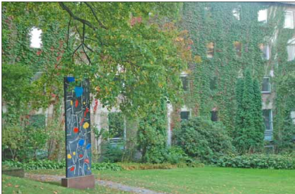
Fig 18. Marabouparken.