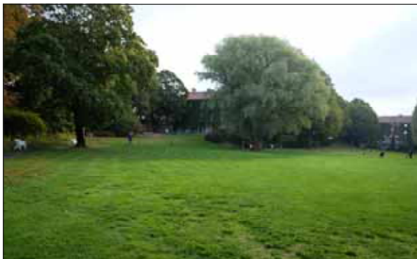
Fig. 16. Marabouparken.

På 2000-talet har en rad bostadshus tillkommit på södra sidan av Landsvägen och längs med Bällstaån. Närmast Bällstaån finns en äldre fabriksbyggnad bevarad, en före detta parfymfabrik från 1899. Fabriken huvudfasad vetter mot vattendraget.