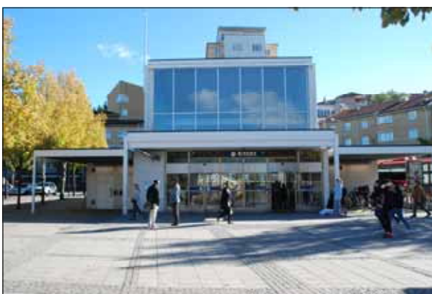
Fig. 26. Torgplatsen i Rissne centrum.

Bostadsbebyggelsen i Rissne ligger på fyra skogsbevuxna höjder, med träd bevarade i sluttningarna. Husen i respektive område hålls samman med gemensamma former och färger. Givna terrängförhållanden har fått styra kvartersindelning och gatunät. Frodig växtlighet har fått breda ut sig i såväl gårdar som gaturum.