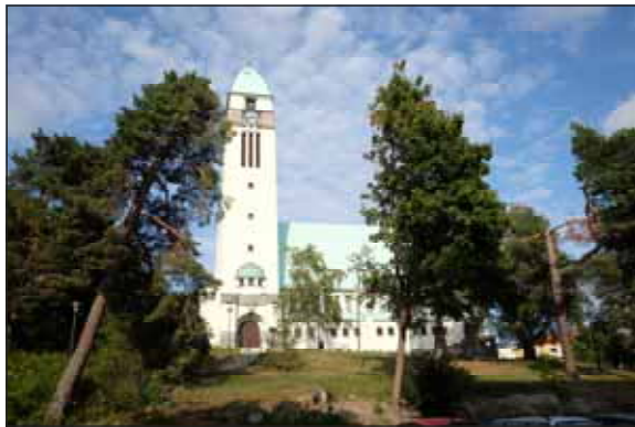
Fig. 9. Sundbybergs kyrka omges av kyrkparken.