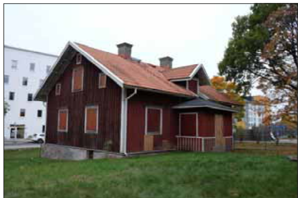
Fig. 36. Stora Ursviks mangårdsbyggnad.

En viktig del av området historia speglar även Miloområdet. Byggnaderna är uppförda under olika tider, de äldsta är från 1930-talet, och de uppvisar många intressanta arkitektoniska uttryck, bland annat sågtandstak.