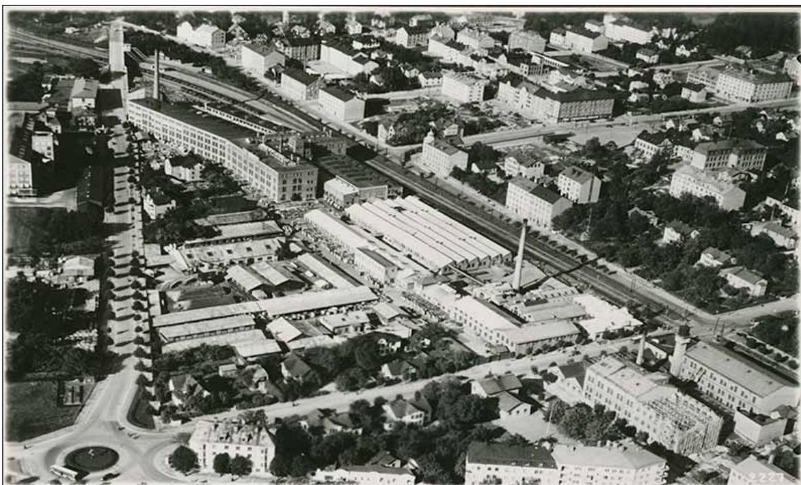
Fig. 3. Ovanstående äldre flygfoto är taget mot nordväst. I förgrunden ses Sundbyberg söder om järnvägen, med Lofströms allé och Esplanaden anlagda som raka huvudgator. Bebyggelsen var mer varierad innan staden omgestaltades efter 1942 års stadsplan.

Ett salutorg ungefär på platsen för dagens torg blev tidigt samlingsplatsen framför andra.