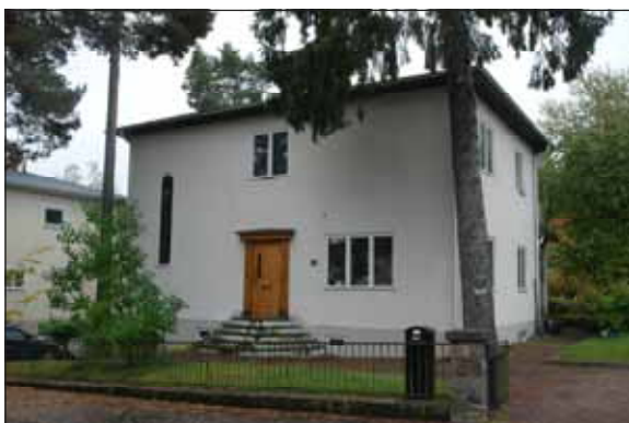
Fig 32. Välbevarad villa på Furuvägen.

1960-talets punkthusområde vid Tuletorget skiljer sig radikalt från områdets tidigare, genom att marken har planerats och hårdgjorts. Fasaderna går i en kallare färgskala. Utmärkande är bottenvåningarnas pelarkantade arkader samt ursprunglig utsmyckning på torget.