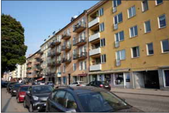
Fig. 7. Sluten kvartersbebyggelse vid Järnvägsgatan.