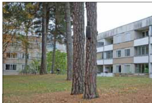
Fig. 37. Lamellhus vid Logdansvägen.

Sedan millennieskiftet har de flesta fasaderna ändrats genom fönsterbyten. På några lamellhus har eternitskivor ersatts med plåt.