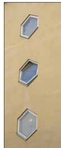
Fig. 6. I Sundbyberg finns gott om sexkantiga fönster. Därför har en hexagon valts som grafiskt element i stadens nuvarande logotyp.

Sundbybergs bebyggelse hade vid det laget redan blivit modern och storskalig.