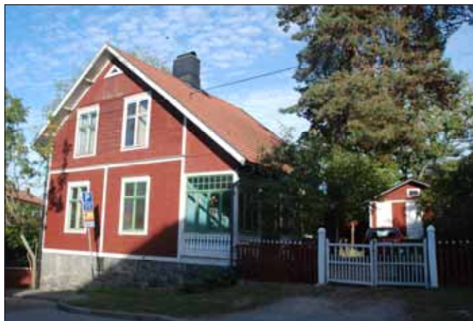
Fig. 25. En av de bevarade trävillorna.

välbevarade med utmärkande detaljer och material i portar och sockelväningar. Av områdets tidiga historia finns Lilla Alby gård kvar med mangårdsbyggnad från 1833. Två välbevarade trävillor finns bevarade på Otterstavägen. Intressant är även den välgestaltade missionskyrkan med omgivande trädgård samt två barnrikehus på Humblegatan. Längs med Bällstaån ligger Sundbybergs f.d. elverk från tidigt 1900-tal - en välbevarad industribyggnad i tegel och puts.