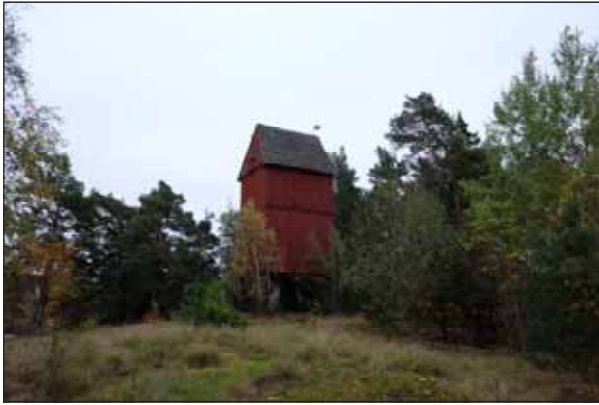
Fig. 35. Stora Stampan, Rinkeby väderkvarnshöjd.

Längs med Gamla Enköpingsvägen finns tre radhuslängor som sticker ut från den övriga villabebyggelsen. De är dock mycket ombyggda. Två villor i korsningen Ursviksvägen/Ungdomsvägen utmärker sig genom sin placering och välbevarade detaljer och ytskikt.