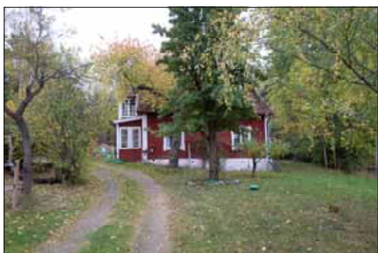
Fig 34. Läderbacka torp

Stora Ursviks gård finns omnämnd sedan 1500-talet och den nuvarande mangårdbyggnaden är från 1873. De timrade gårdsbyggnaderna är rivna.