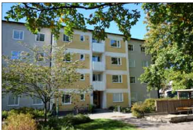
Fig 29. Putsfasader i jordfärger och dova pasteller dominerar.

Det långsmala villakvarteret i sydväst innehåller blandad bebyggelse från 1900-talet varav ett antal villor är välbevarade exempel från sina respektive tidsperioder.