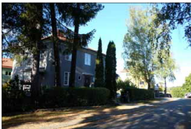
Fig. 23. Området har ett svängt gatunät och stort inslag av grönska.

Representativa villor för industriernas högre tjänstemän uppfördes på områdets södra sluttningar i början av 1900-talet. I kvarteret Enen uppfördes vid samma tid ett flerbostadshus i jugendstil längs med Järnväggsgatan. Halva kvarteret kom att bebyggas med sluten kvartersbebyggelse medan andra halvan bebyggdes med villor enligt den stadsplan som fastslogs 1925 och där Hästhagen reserverades för villa-bebyggelse utmed ett slingrande gatunät, underordnat naturliga terrängförhållanden. Området var i princip fullbebyggt vid slutet av 1920- och början av 1930-talet. Då stadsplanebestämmelserna inte varit tillräckligt detaljerade blev det dock inte ett renodlat villaområde så som det var tänkt, utan även hyreshus i två våningar kom att uppföras, främst i områdets norra och östra delar. I det slutna kvarteret har ett nytt hus uppförts under 2010-talet.