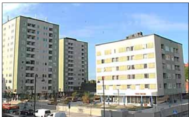
Fig. 12. Punkthusen vid Tuletorget uppfördes på 1960-talet.