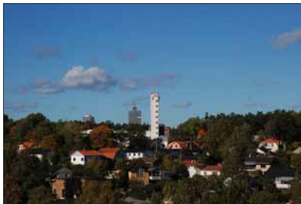
Fig. 33. Hissprovningstornet i Lilla Ursvik.

Lilla Ursviks nuvarande mangårdsbyggnad härrör från 1800-talet. Gården köptes 1894 av uppfinnaren Gustav de Laval som bedrev jordbruk och jordbruksteknisk forskning. 1906 såldes den vidare till skotten Peter Samuel Graham som anlade en hissfabrik på gårdens marker och bland annat lät uppföra det hissprovningstorn som numera är ett viktigt landmärke. Mangårdsbyggnaden blev nu disponentbostad. 1906 lät Graham bygga 14 enhetligt utformade villor på Egnahemsvägen åt fabriken arbetare. Vid en ekonomisk nedgång för företaget började resten av gårdens mark styckas upp och säljas av, och ett villasamhälle växte så småningom fram. Främst kom området att bebyggas med kataloghus från 1940-talet. Hisstilverkningen pågick fram till slutet av 1970-talet. Därefter har en rad olika industrier och verksamheter verkat på platsen. I villaområdet har några nya villor tillkommit bland annat längs med Milstensvägen under 2000-talet.