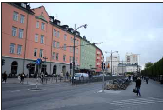
Fig. 14. Kvarteret Bageriet. Kvarterets svängda form bildar en karakteristisk fond mot spårområdet och torget.

Bebyggelsen i stadens östra utkanter, närmast gränsen mot Solna, är mer storskalig. Här förekommer kvarterstäckande, 6-12 våningar höga kontorshus, med karakteristiska fönsterband.