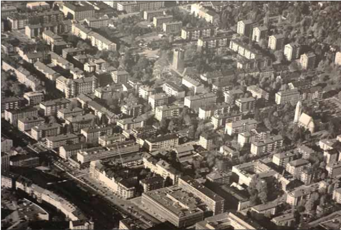
Fig. 5. Flygfoto över Sundbyberg från nordost som visar bebyggelsen norr om järnvägen efter genomförandet av 1942 års stadsplan. Källa: Sundbybergs museum.

nadsverksamhet. På Sterners förslag infördes lamellhus som genom sitt fristående läge skulle medge mer plats för sol, ljus och grönska.