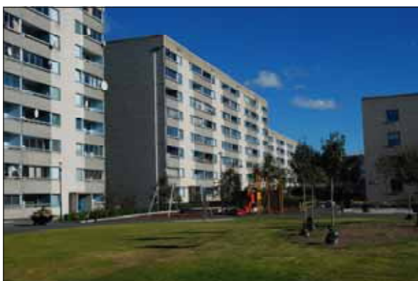
Fig. 22. Hallonbergen är ett trafikseparerat område.

Bostadsbebyggelsen ligger samlad i sju högt belägna lamellhuskvarter, orienterade i öst-västlig riktning, där placeringen styrts av såväl höjdlinjer som en tidigare befintlig kraftledning. Husen är uppförda på berg som plansprängts. I närheten har dock enstaka naturliga höjder sparats, varav Hallonbergstoppen är den största. Omgivande skogsvegetation är också till stor del naturlig. Ett bilfritt gångstråk förbinder bostadskvarteren med Hallonbergens centrum, som ligger längst österut på något lägre, mindre kuperad terräng.