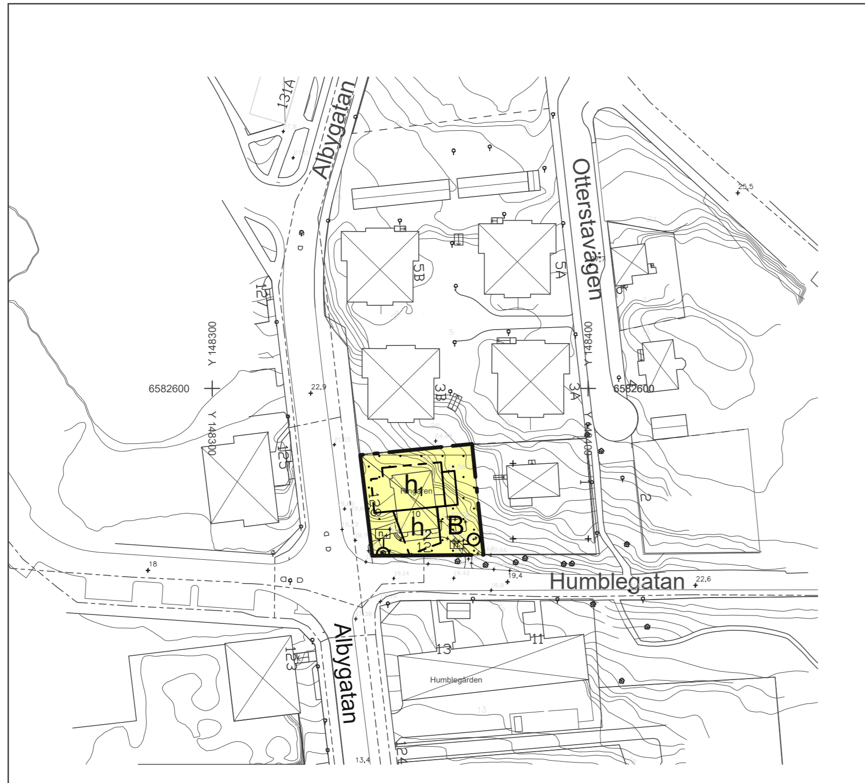
Skala 1:1000 i A2-format