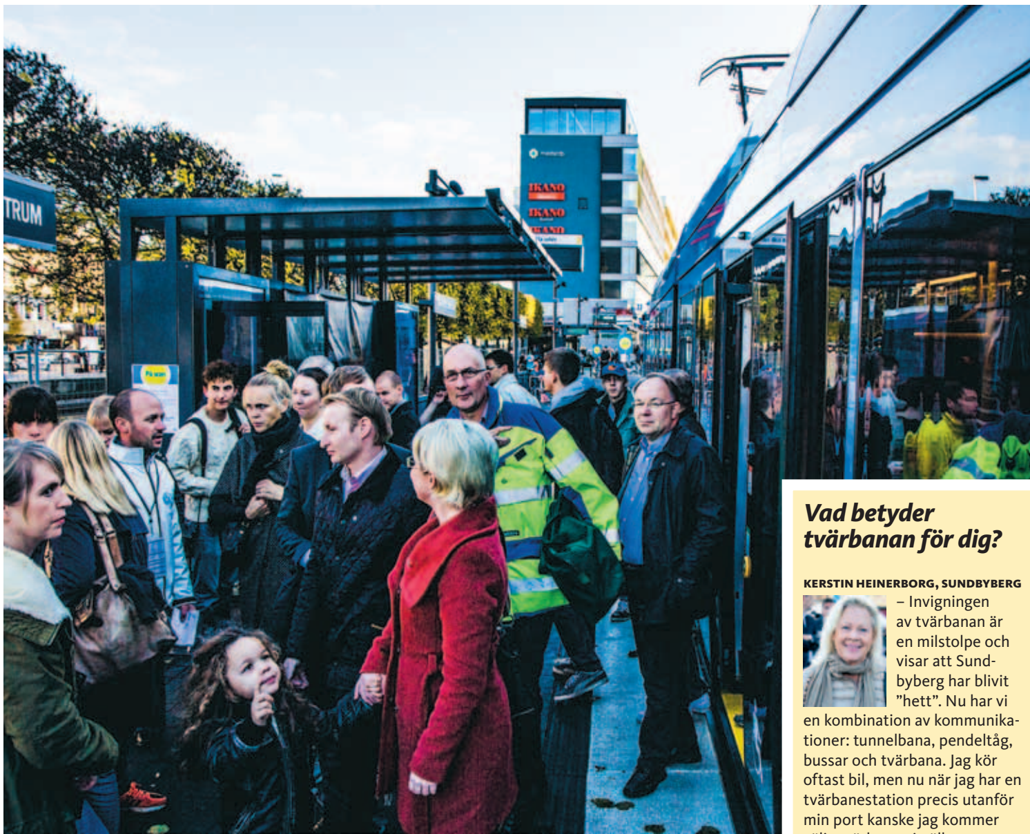
Sundbybergarna köade för att få åka tvärbanans premiärtur.