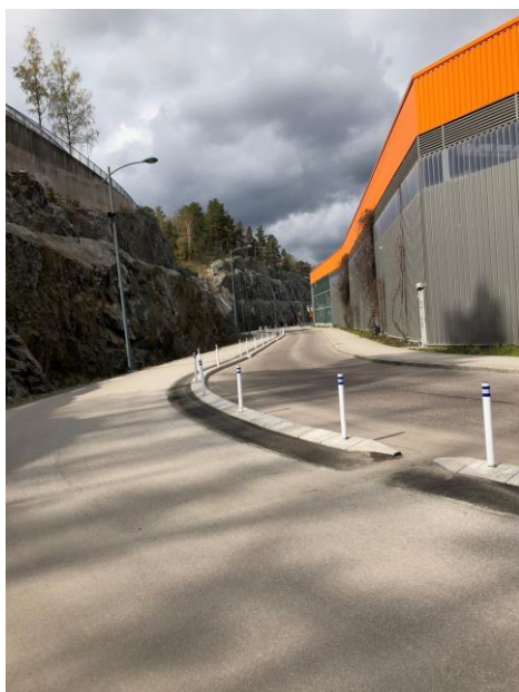
Ny cykelbana Östra Madenvägen.