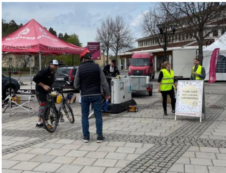
Gratis cykelservice och cykeltvätt på Rissne torg

Precis som året innan genomfördes en bilfri vecka i flera av stadens skolor Eleverna (och föräldrarna) uppmuntrades att cykla eller gå till skolan under denna vecka.