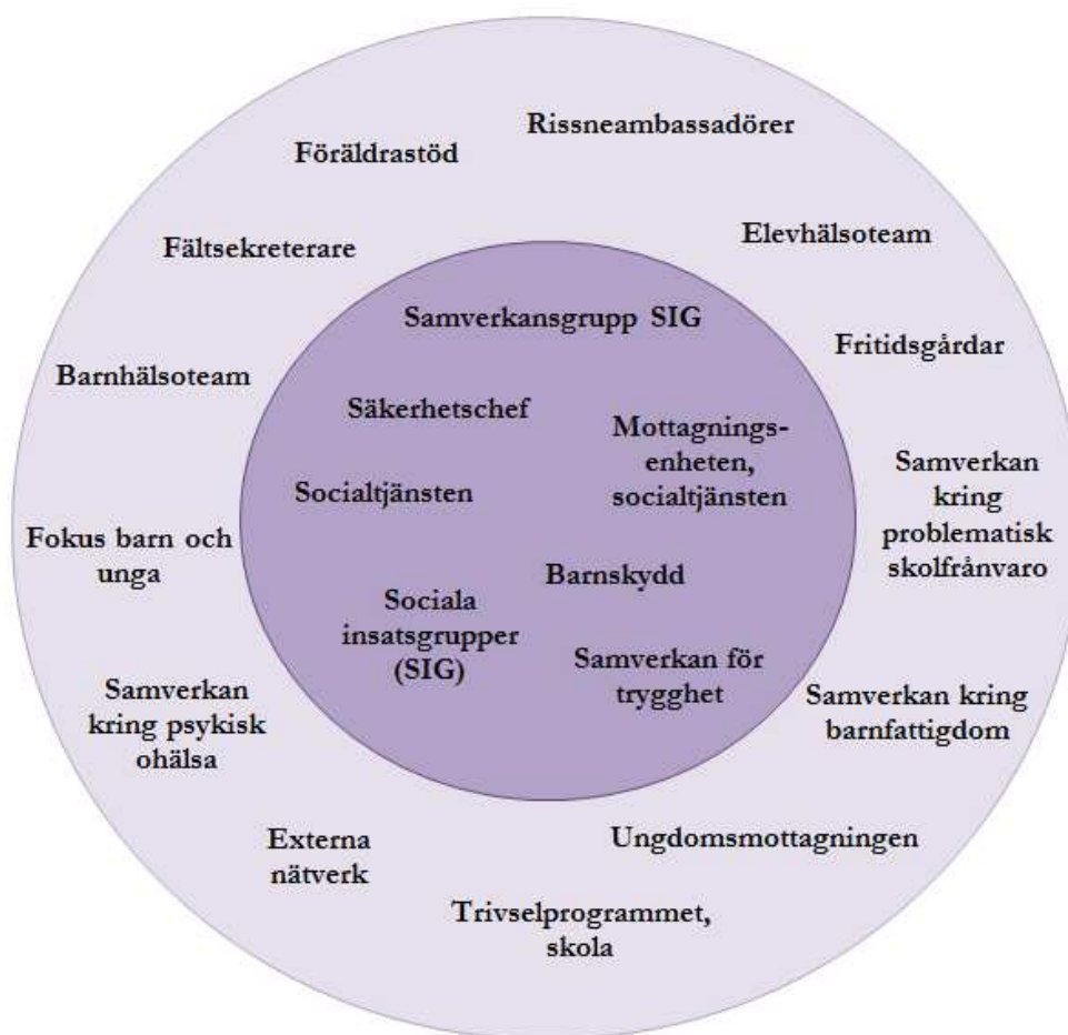
Figur 1: Förebyggande basverksamhet i Sundbybergs stad (ej uttömmande).

I figur 1 visas de verksamheter och strukturer som finns inom staden som förebygger våldsbejakande extremism och andra normbrytande beteenden. De