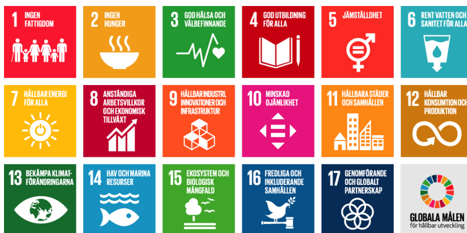
Figur 1. Bild över de 17 globala målen.

År 2015 beslutade världens ledare genom FN om ett gemensamt arbetssätt för hållbar utveckling i världen. Det fick namnet Agenda 2030 och innehåller 17 globala mål och 169 delmål. En viktig princip är att målen är integrerade och odelbara vilket innebär att inget mål kan nås på bekostnad av ett annat och att framgång krävs inom alla mål för att vi ska lyckas med genomförandet. Agendan måste genomföras med särskild hänsyn till de människor och samhällen som har sämst förutsättningar. Agendan är global, men det är på den lokala nivån som stora delar av arbetet med målen kan omsättas i praktiken. Genom att agera lokalt tar staden ansvar för och bidrar till en global hållbar utveckling.