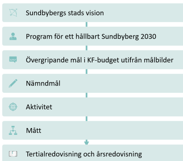
Figur 2. Schematisk bild av programmets implementering.

Implementering av programmet sker i den ordinarie processen för planering och uppföljning inom Sundbybergs stad. På så sätt integreras arbetet med Agenda 2030 och hållbarhetsprogrammet i det ordinarie arbetet och blir inte en sidoordnad styrning. Programmets målbilder och inriktningar ska vara en utgångspunkt för mål och uppdrag i den årliga budgeten som beslutas av kommunfullmäktige i Sundbybergs stad. Mål och uppdrag kan i sin tur konkretiseras och kompletteras i planeringen för nämnder, bolag och sektorer. Schematisk bild över strukturen redovisas nedan.