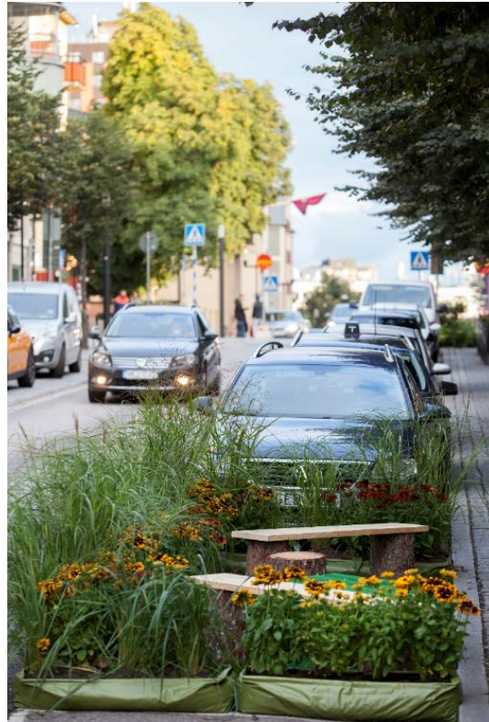
Pop-up-parker på Sturegatan under trafikantveckan.