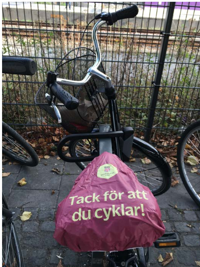
Bild från Trafikantveckan 2016

För att utveckla och utvärdera resan till en cykelvänlig stad gör Sundbybergs stad ett cykelbokslut.