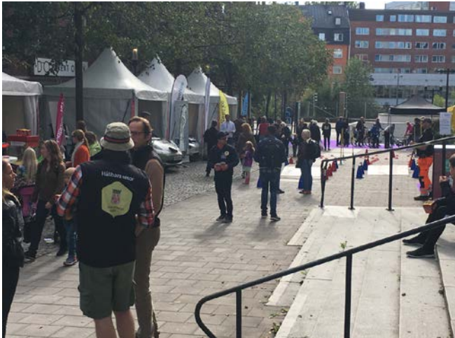
Evenemang på Stationsgatan under trafikantveckan.

I centrala Sundbyberg fanns cykelmekaniker på plats under tisdagen den 19 september för att serva och reparera medborgarnas cyklar utan kostnad.