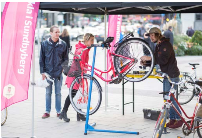
Gratis cykelservice på Sundbybergs torg under trafikantveckan.

I centrala Sundbyberg fanns cykelmekaniker på plats under tisdagen den 19 september för att serva och reparera medborgarnas cyklar utan kostnad.