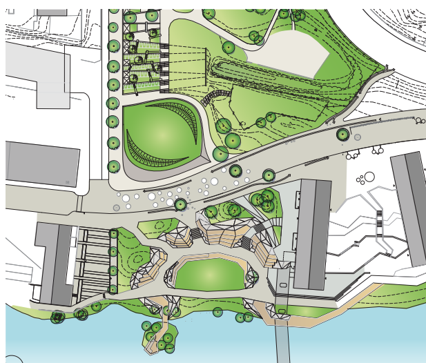
Nya bostäder, uppfräschad park och gångbro till Stockholm Stad.

Nu fortsätter nybyggnationen av bostäder mellan Bällstaån och Hamngatan. Det är Folkhem, Wählin Fastigheter, Borätt och Seniorgården som bygger bostäder från Tuvanparken fram till gränsen mot Solna.