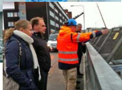
Många ville se den nya bron lyftas på plats.

Bron kommer att tas i trafik först 2013, då tvärbanan är färdigbyggd.