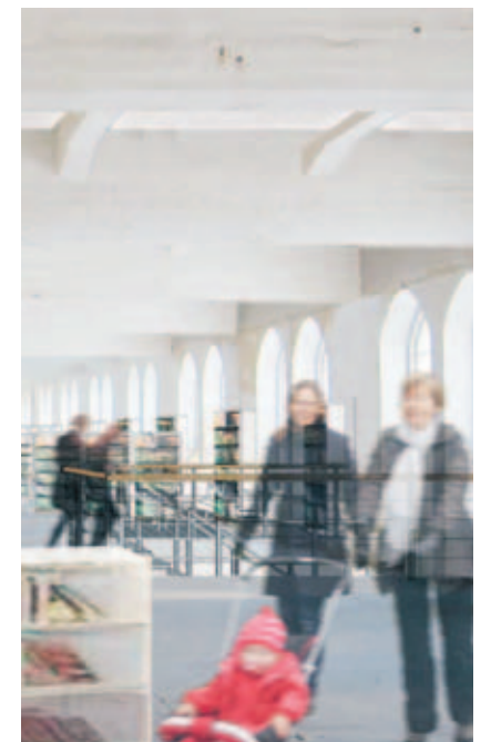
Detalj från den kommande biblioteket. Bild från Visbyark, Nyréns.

Sundbybergare och andra intresserade har möjlighet att påverka bibliotekets utformning, ställa frågor och följa bibliotekets framväxt. Utvecklingen av det nya biblioteket dokumenteras nämligen på bloggen www.signalbibblan.wordpress.com .