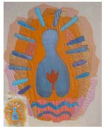
Tulpanaros av Rebecca Weiss efter en skiss av Helga Henschen.

Läs mer på sundbyberg.se under Kultur & fritid.