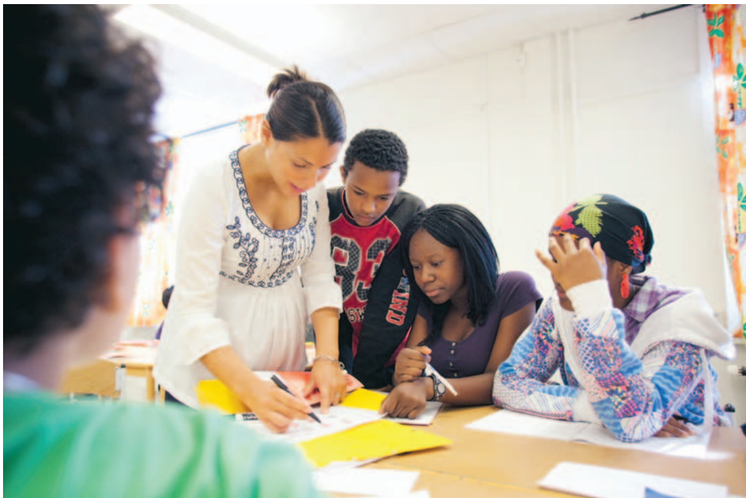
Flera skolor passar på att arrangera sin egen demokrativecka.