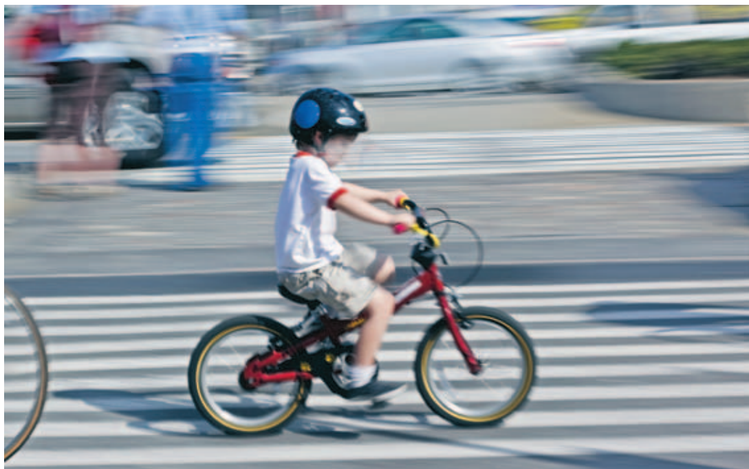
Barn och ungdom är målgrupp för den nya hälsosatsningen.

Nu närmast kommer till exempel författaren och psykologen Bengt Grandelius den 4 oktober och berättar om gränssättning, fysisk aktivitet och goda matvanor. Han har länge arbetat med ungas psykiska och fysiska hälsa,