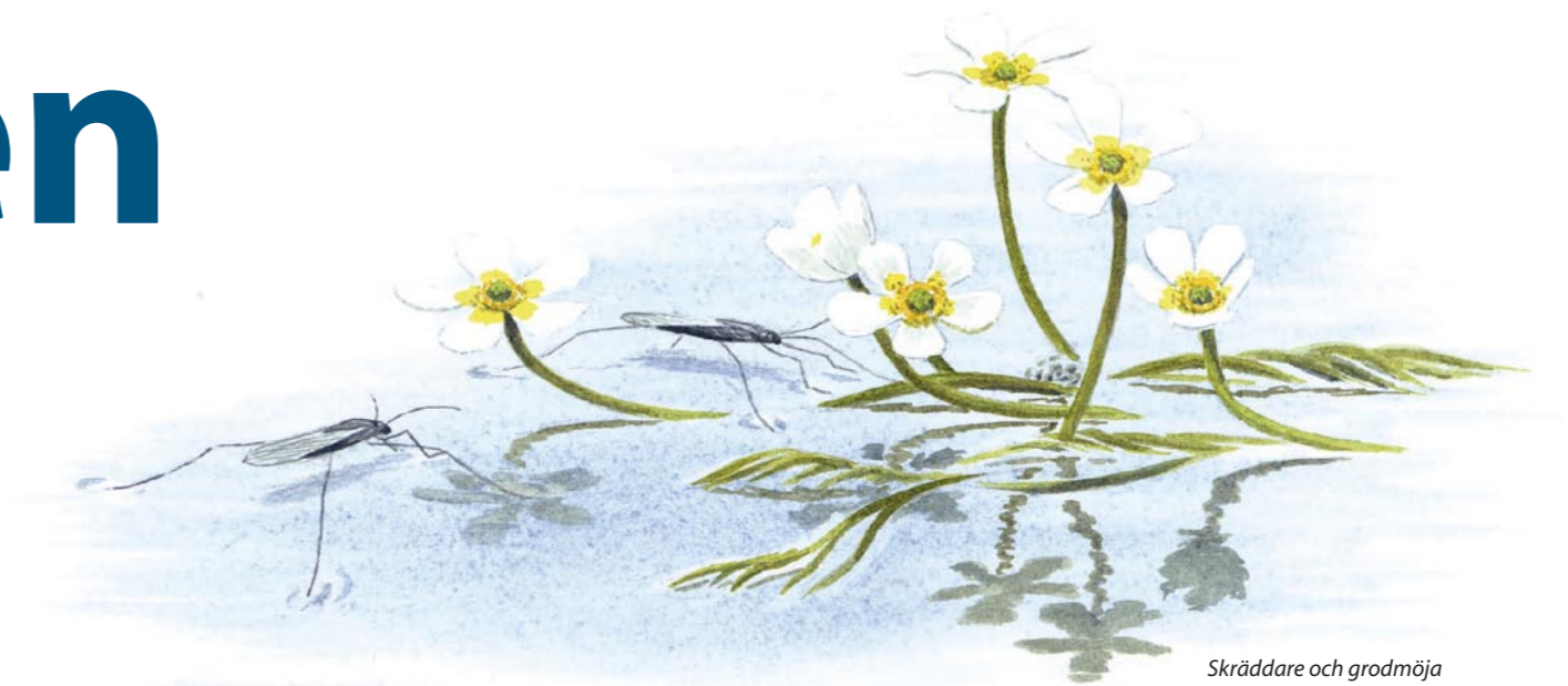
Skraddare och grodmöja

Här, där du står, växer bland annat kabbleka, vattenveronika, vass, vasstarr, svärdsilja, sjöfräken, sjöranunkel, strandklo, svalting, strandlysing samt den mindre vanliga grodmöjan. I bäcken finns flera sällsynta ryggradslösa djur, bland andra kuvertbyggarslända, nattsländan Ironoquia dubia , mosaiktrollslända och glanssnäcka. I och på vattnet finns bland annat dykare, fjädermygglarver, hundiglar, märkräftor, skraddare, sötvatten-gråsuggor och ärtmusslor.