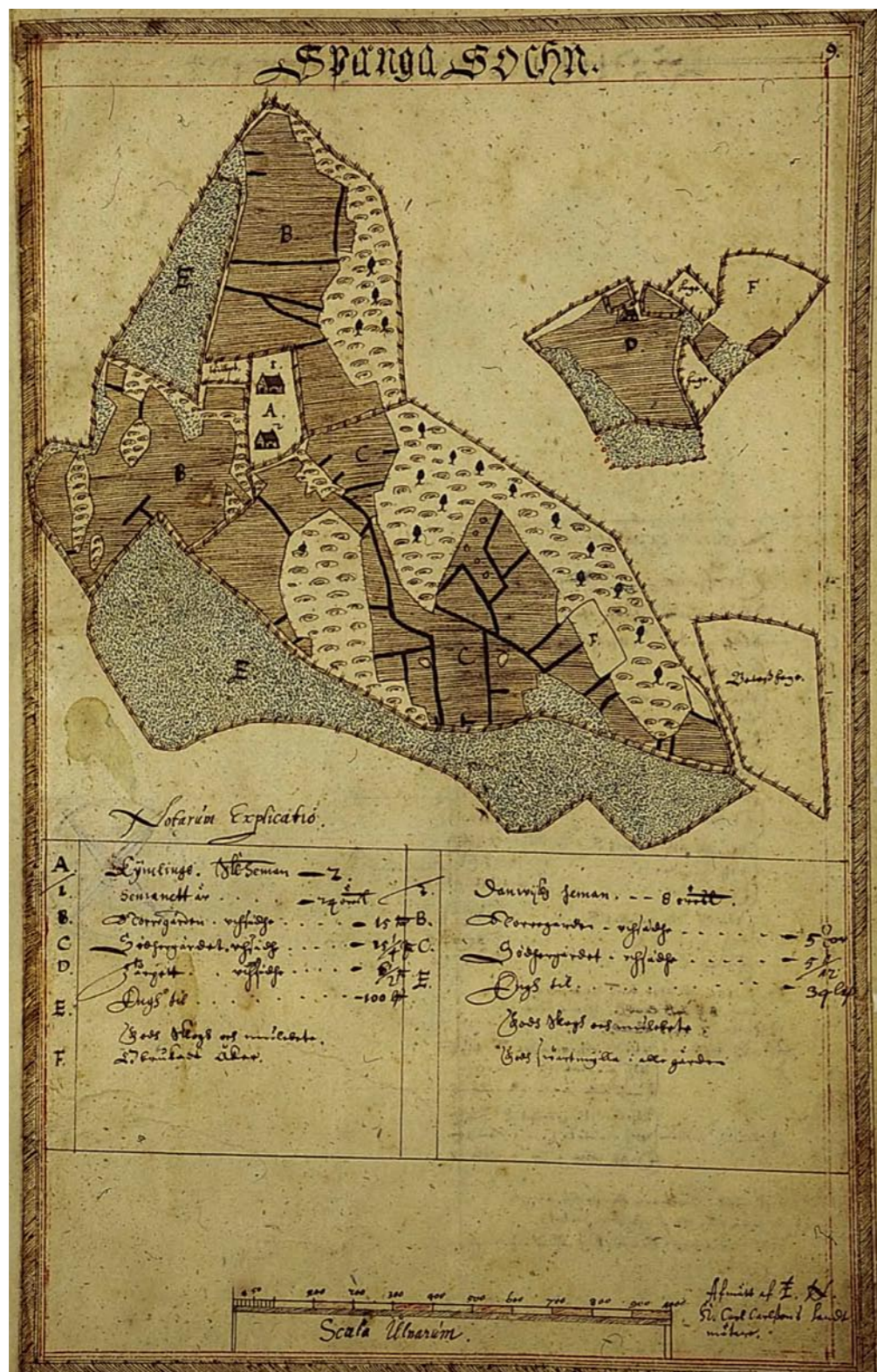
Karta över Kymlinge 1636. Stockholms läns museum

I det som nu är Igelbäckens naturreservat har människor stadigvarande bott och brukat marken i mer än tusen år. Igelbäcken var förr ett bredare vattendrag och utgjorde en naturlig färdväg genom området. Under medeltiden fanns fyra större bosättningar i nuvarande norra Sundbyberg: Råsta, Lilla Ursvik, Stora Ursvik och Kymlinge.