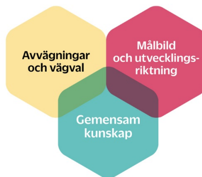
Figur 1 Sammanfattning av översiktsplanens delar. Illustration: Gustav Lindkvist, Sundbybergs stad.