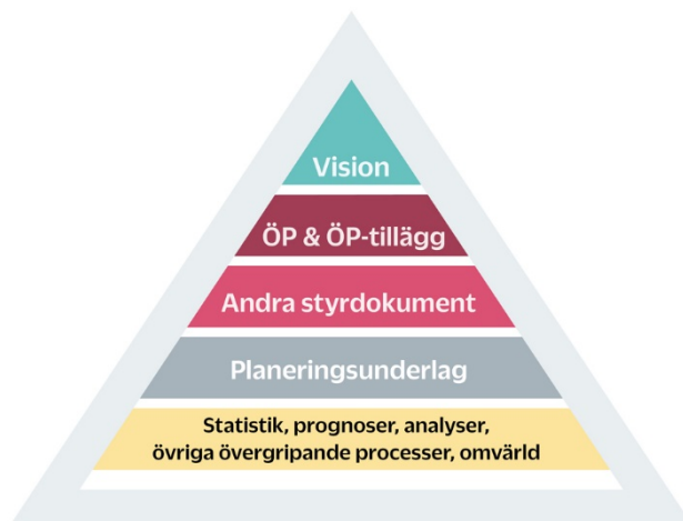
Figur 2 Ett system som hänger ihop och som kompletteras kontinuerligt – Översiktsplanen, tillägg till översiktsplanen, andra styrande dokument och planeringsunderlag påverkar och påverkas av varandra. Grunden består bland annat av tillgång till analyser. Illustration: Gustav Lindkvist, Sundbybergs stad.

En snabb utveckling förutsätter en effektiv process för planering, som underlättar styrning enligt demokratiskt fattade beslut. Därför erbjuder plan- och bygglagen ett arbetssätt för översiktsplanering, som innebär att översiktsplanen utvecklas kontinuerligt genom tillägg och fördjupningar. Även andra styrande dokument behöver utvecklas parallellt och hållas à jour, för att kontinuerligt komplettera och tillföras översiktsplanen. Översiktsplanens efterlevnad kopplas därmed även till stadens styrmodell samt planerings- och uppföljningsprocess.